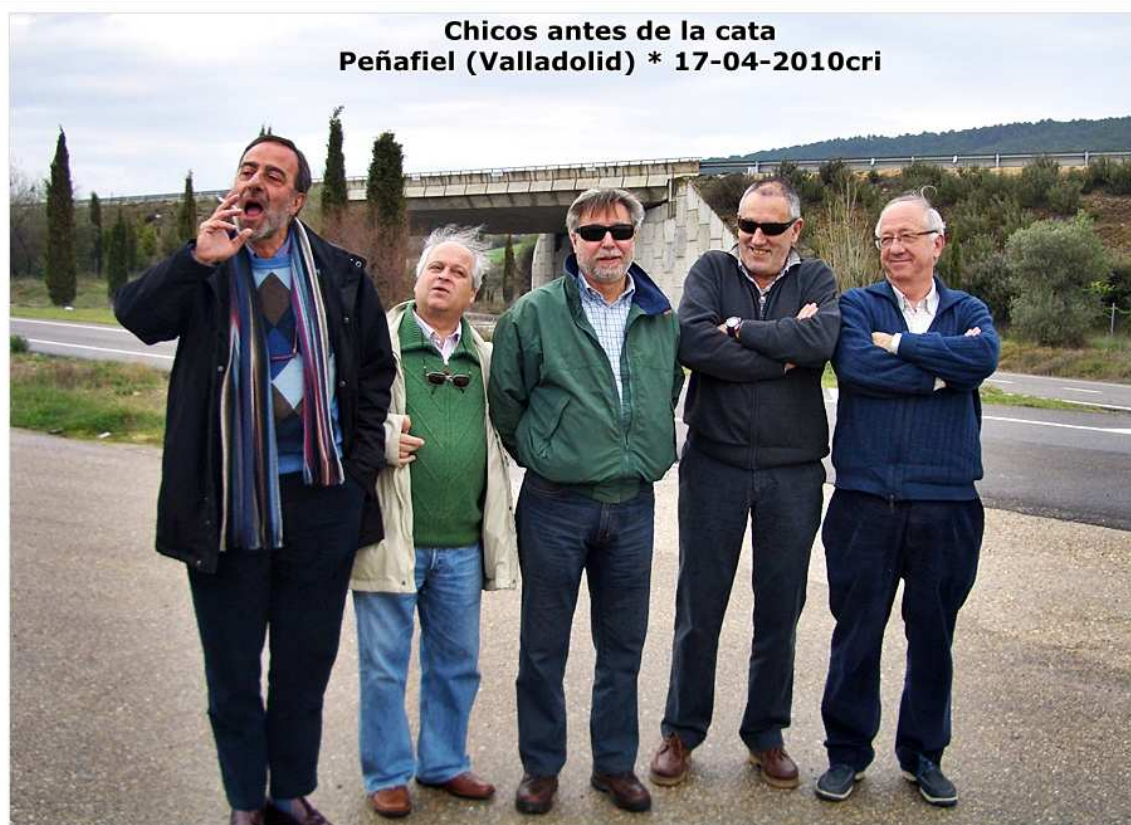
Chicos antes de la cata Peñafiel (Valladolid) * 17-04-2010cri