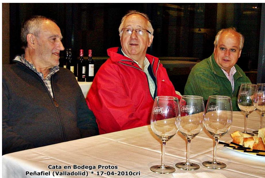
Cata en Bodega Protos Peñafiel (Valladolid) * 17-04-2010cri